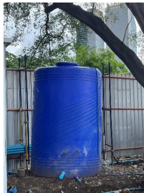
รูปที่ 8 ถังสำรองน้ำภายในโครงการ