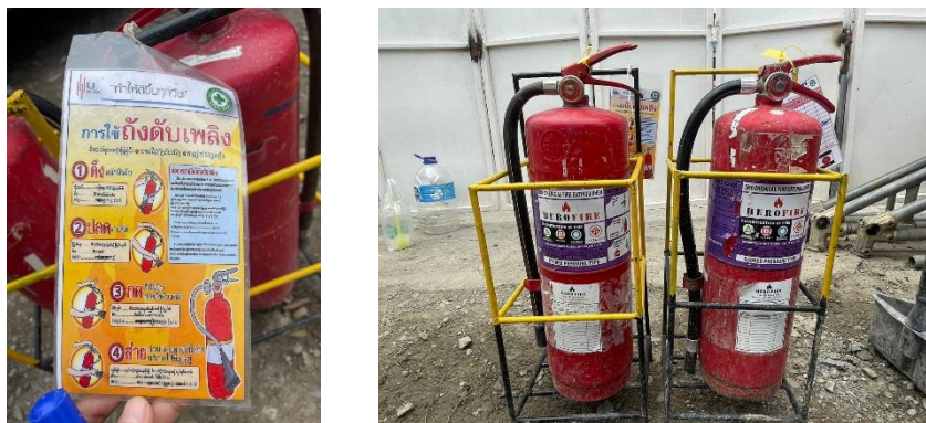
รูปที่ 11 ถังดับเพลิง