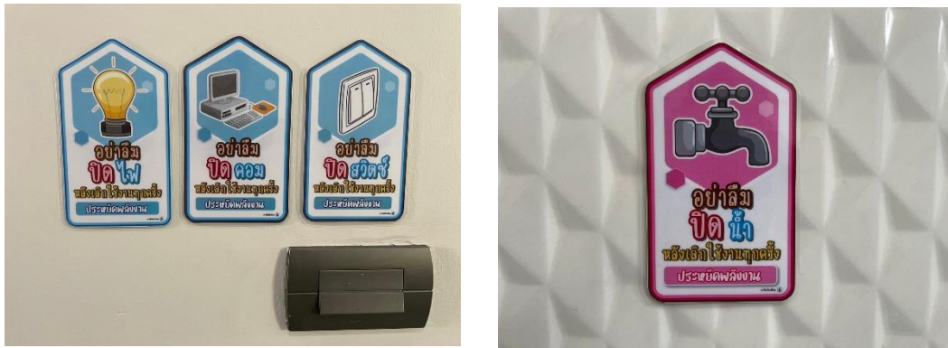
รูปที่ 10 ป้ายรณรงค์ประหยัดน้ำประหยัดไฟ

รายงานผลการปฏิบัติตามมาตรการป้องกันและแก้ไขผลกระทบสิ่งแวดล้อม และมาตรการติดตามตรวจสอบคุณภาพสิ่งแวดล้อมโครงการ โคลส รัชดา 7 (KLOS RATCHADA7) (ระยะรื้อถอนและก่อสร้าง) ของบริษัท แกรนด์ พาราไดส์ พร็อพเพอร์ตี้ จำกัด3-84