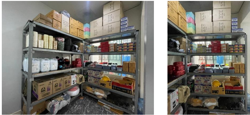
รูปที่ 13 ห้องสโตร์

รายงานผลการปฏิบัติตามมาตรการป้องกันและแก้ไขผลกระทบสิ่งแวดล้อม และมาตรการติดตามตรวจสอบคุณภาพสิ่งแวดล้อมโครงการ โคลส รัชดา 7 (KLOS RATCHADA7) (ระยะรื้อถอนและก่อสร้าง) ของบริษัท แกรนด์ พาราไดส์ พร็อพเพอร์ตี้ จำกัด3-84