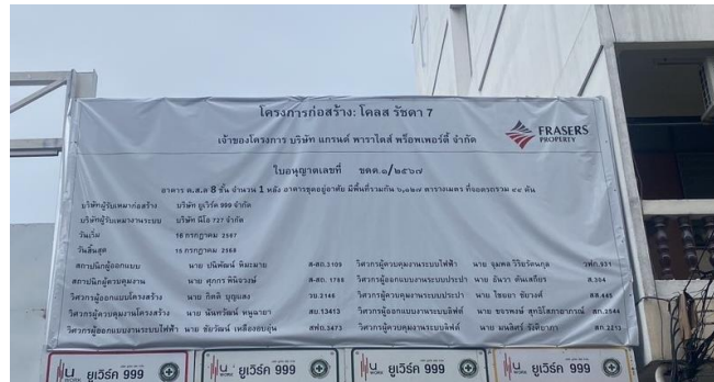
รูปที่ 1 ป้ายรายละเอียดโครงการ