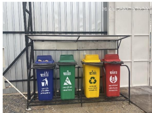
รูปที่ 9 ถังรับมูลฝอย