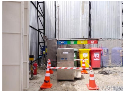
รูปที่ 7 การตรวจวัดคุณภาพสิ่งแวดล้อม