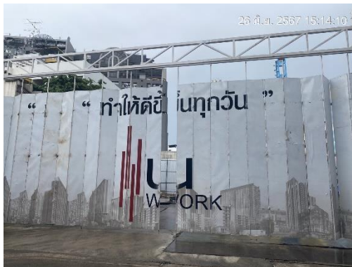
รูปที่ 4 ทางเข้าออกปิดที่ตลอดเวลา

รายงานผลการปฏิบัติตามมาตรการป้องกันและแก้ไขผลกระทบต่อสิ่งแวดล้อม และมาตรการติดตามตรวจสอบคุณภาพสิ่งแวดล้อมโครงการ โคลส รัชดา 7 (KLOS RATCHADA7) (ระยะรื้อถอนและก่อสร้าง) ของบริษัท แกรนด์ พาราไดส์ พร็อพเพอร์ตี้ จำกัด3-84