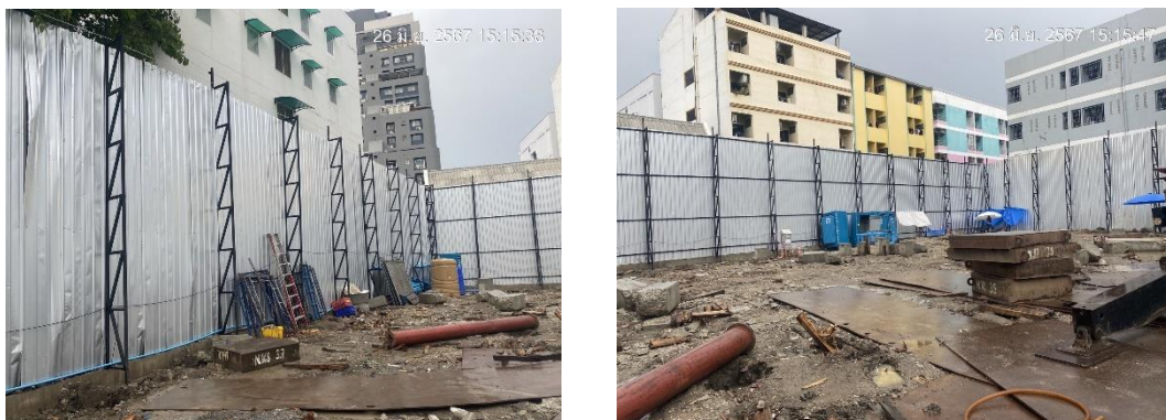
รูปที่ 3 รื้อ Metal Sheet

รวบรวมการปฏิบัติงาน โดยเจ้าหน้าที่ของโครงการ และทีมงานบริษัท ทีเอ็นพี เอ็นไวรอนเม้นท์ จำกัด