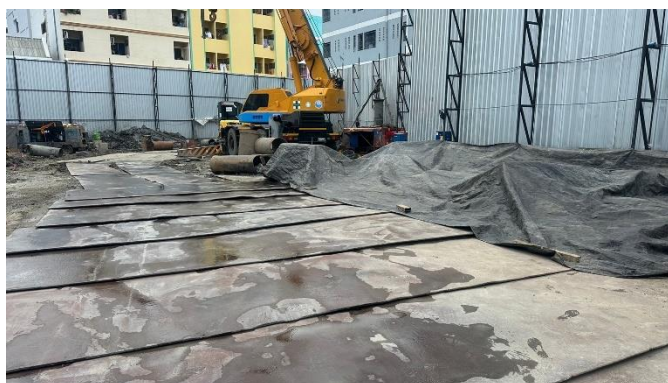
รูปที่ 6 แผ่นเหล็ก

รวบรวมการปฏิบัติงาน โดยเจ้าหน้าที่ของโครงการ และทีมงานบริษัท ทีเอ็นพี เอ็นไวรอนเม้นท์ จำกัด